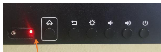
DB IN STAND-BY